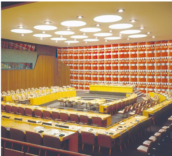
UNO-SOC Versammlungsraum im UNO-Hauptquartier in New York mit Pythagoras-Vorhang von Sven Markelius

Der Architekt und Designer Sven Markelius ist eine Ikone des schwedischen Funktionalismus'. Bei seiner Arbeit für das 1952 eröffnete UNO-Hauptquartier in New York entstand das Pythagoras-Design – aus dem experimentellen Spiel mit ausgeschnittenen Dreiecken. Auch heute noch wird das prägnante Muster im schwedischen Rydboholm handbedruckt. Es erfordert eines der kompliziertesten und aufwändigsten Druckverfahren mit achtzehn verschiedenen Sieben in doppelten Wiederholungen: ein Prozess, bei dem jede Farbe einzeln gedruckt wird. Daraus entstehen besonders kräftige Farben mit klaren Kanten, die diese einzigartige handwerkliche Kunst vermitteln. Ljungbergs Factory – der Partner von Bemz für die aktuelle Zusammenarbeit – nutzt diese Methode des Textildrucks seit 1834.