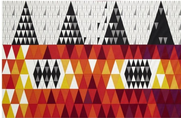
Pythagoras - Red