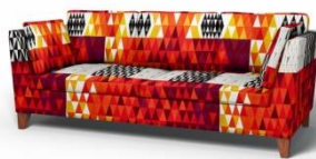
IKEA Stockholm 3er Sofa*

Benz-Bezüge mit dem Pythagoras-Muster von Sven Markelius gibt es für folgende IKEA-Sofamodelle (*aktuelle IKEA-Kollektion) – Bezüge erhältlich bis Ende 2015: