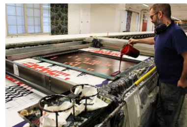
Druck des exklusiven Pythagoras-Stoffes in Ljungbergs Factory