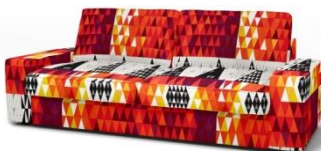
IKEA Kivik 3er Sofa*