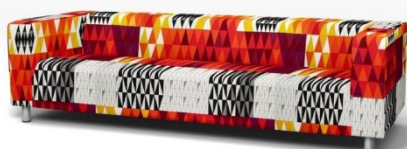
IKEA Klippan 4er Sofa