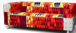
IKEA Klippan 2er Sofa*