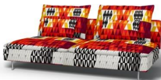
IKEA Söderhamn 3er Sitzelement*