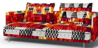
IKEA Söderhamn 3er Sofa*