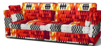
IKEA Stockholm 3,5er Sofa