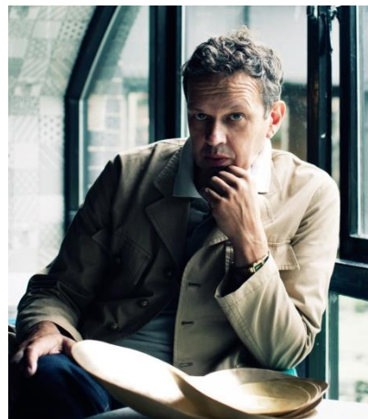
Tom Dixon Gründer und Designer

Tom Dixon , Gründer und Designer, sagt zu der Zusammenarbeit mit Bemz: „Im Allgemeinen ist die Möbelindustrie noch immer eine verschlafene und langsame Welt – nach wie vor nicht gestört oder im Einklang mit der sich schnell verändernden Umgebung unserer Zeit. Als wir unsere Arbeit mit IKEA an dem Bett/Sofa Projekt DELAKTIG begonnen haben, wollten wir Partner finden, die begreifen, welche Möglichkeiten sich um uns herum bieten, wenn man in diesem Segment anders denkt. Bemz hat sofort reagiert: Sie waren die ersten, die die Herausforderung angenommen und sich auf dieses Abenteuer eingelassen haben – auf ein offenes und veränderbares Bettgestell, das beliebig modifiziert, transformiert und aufgewertet werden kann.“