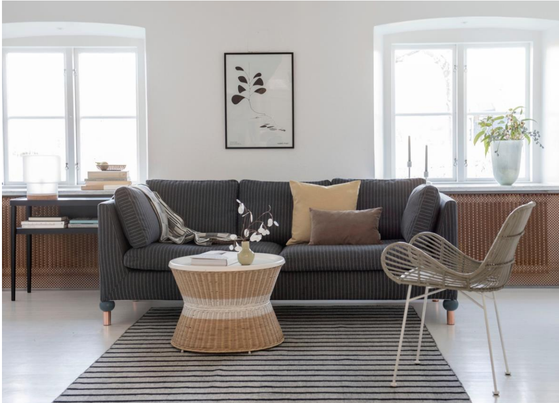
IKEA Stockholm 3er Sofa mit Bemz-Bezug in Vreten Pinstripe Graphite Grey (419 €) und Bemz-Kissenbezug 50x50 cm aus Tegner Melange Straw Yellow (25 €).

Textilien, die ausschließlich aus Restprodukten der Bekleidungsindustrie gefertigt werden – und das ohne den Verbrauch von Wasser oder Färbemitteln: Mit der Respect Collection hat Bemz ( www.bemz.com ) 2015 eine Produktpalette lanciert, die den Respekt für die Umwelt nicht nur im Namen trägt. Im Februar 2016 erneuert die schwedische Designfirma ihr Bekenntnis zu Nachhaltigkeit und erweitert diese Kollektion um vier neue, elegante Stoffe. Ob als Möbelbezug für eine Vielzahl verschiedener IKEA-Modelle oder als Kissenbezug, Tagesdecke oder Vorhangstoff: Mit der Bemz Respect Collection kann jeder sein Zuhause ganz einfach und auf natürliche Weise veredeln.