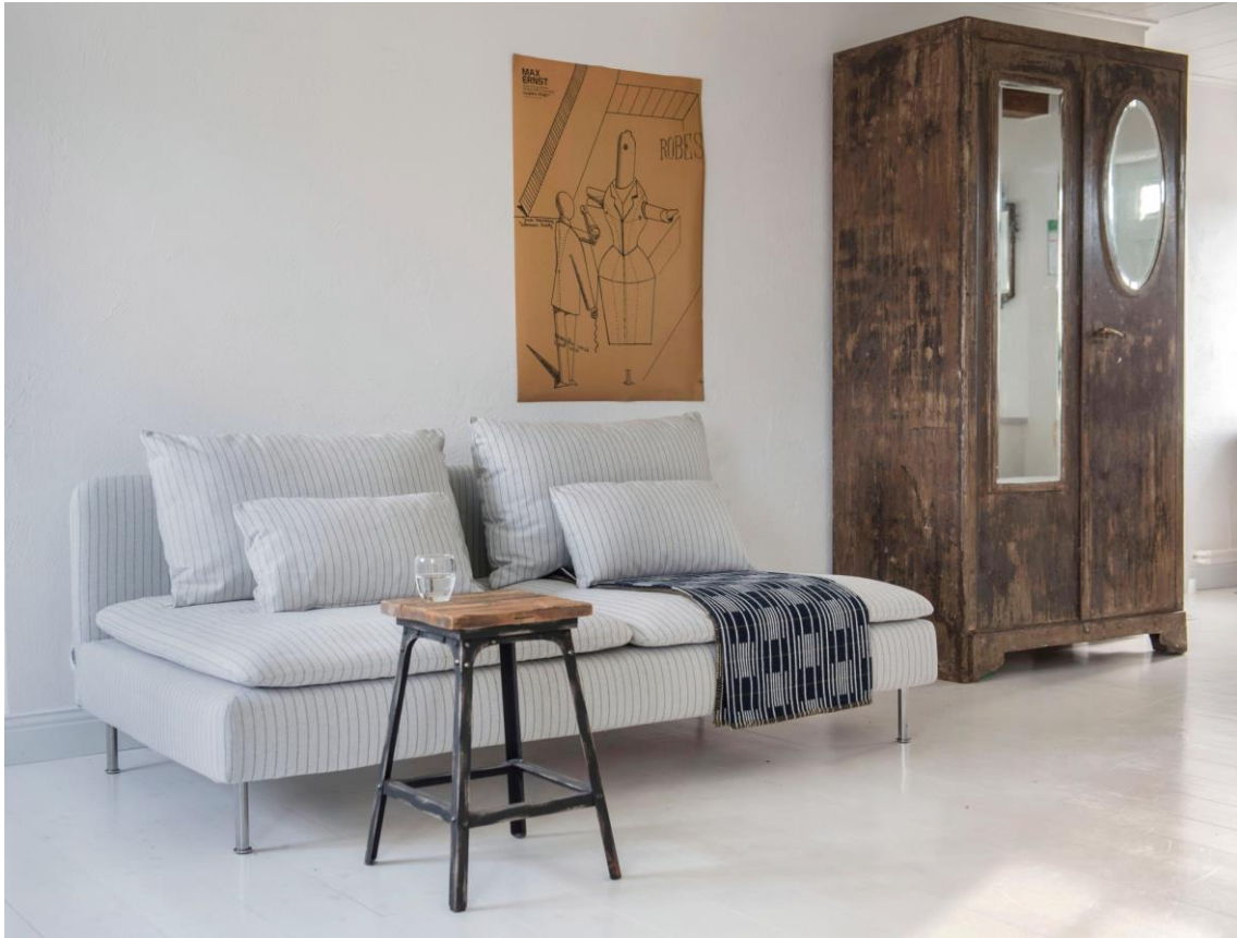
Söderhamn 3er Sitzelement mit Bemz-Bezug in Lunda Pinstripe Silver Grey (319 €).