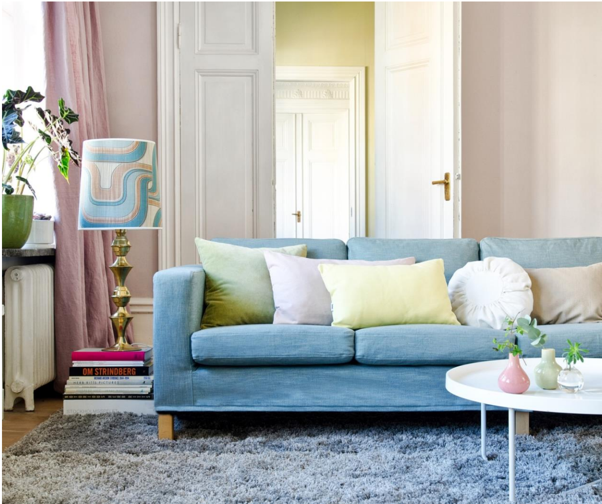
Die Pantone Farben des Jahres 2016 – interpretiert von Bemz.

→ Hoch auflösendes Bildmaterial unter http://bit.ly/1SQnhy