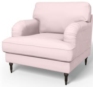
Bemz-Bezug für den IKEA Stocksund Sessel in Dusty Rose Panama Cotton (189 €)