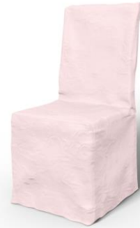
Bemz Multifit-Stuhlhusse in Dusty Rose Panama Cotton (39 €)