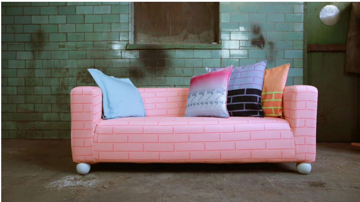
Teil der limitierten Jubiläumskollektion zum zehnjährigen Firmengeburtstag – die neueste Kreation von Bemz-Designerin Katarina Wiklund: IKEA Klippan 2er Sofa mit dem Bezug Brick Building Pink (199 €). Dazu von ihr ausgewählte Bemz-Kissenbezüge (v.l.n.r.): Aqua Panama Cotton 50x50 cm (15 €), Pink Fiskis 50x50 cm (49 € / aus der Bemz Artist Collection), Brick Pink 50x50 cm (45 €), Brick Block Black 50x50 cm (45 €) und dahinter Lillhagen White von Maria Rothman 50x50 cm (35 €).