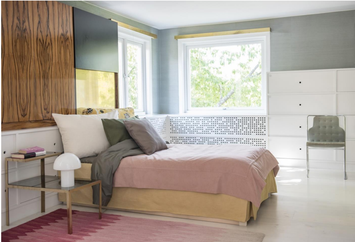
Bemz-Tagesdecke in Rose Chenille (249 €).