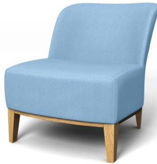
Bemz-Bezug für den IKEA Stockholm Sessel (klein) in Light Denim Blue Belgian Linen (85 €)