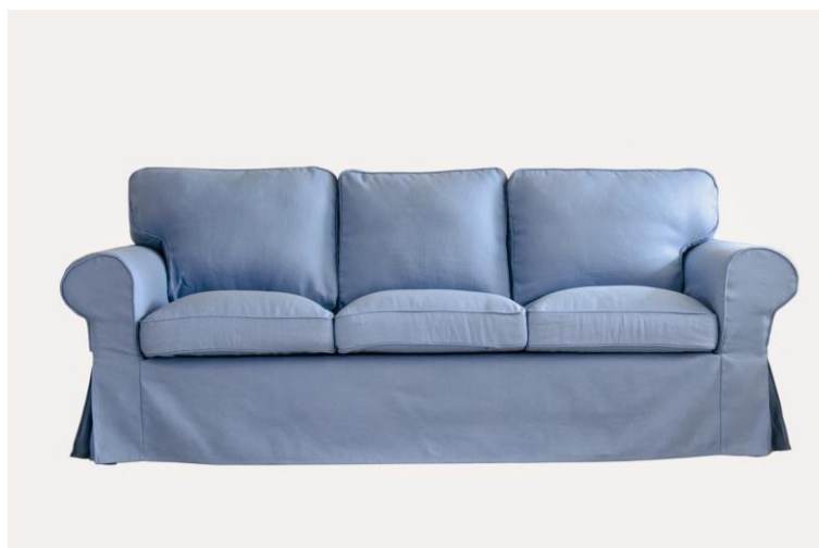
Bemz Bezug für das IKEA Ektorp 3er Sofa in Light Denim Blue Belgian Linen (509 €)

Claudia Gabriel , Bemz Medienbüro Deutschland Tel.: +49 176 60 81 01 89, E-Mail: mail@claudiagabriel.de